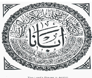
The Lord's Prayer in Arabic

Taxisjåføren gjer det nok for tidobbel takst, men samtidig vil han verne staden, og då er det heller ikkje mykje å sjå der for ein turist.